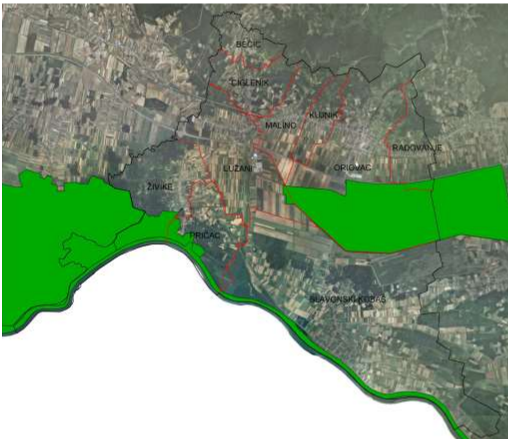
Slika 2. Zaštićena područja (Natura 2000)

Na području općine Oriovac postoje područja koja se nalaze u području ekološke mreže (Natura 2000)- prikaz slika 2; i to dio k.č. br. 3029 te k.č. br. 3021/1, 3022, 3023, 3024, 3025, 3026, 3027, 3028, 3114, 3116, 3117, 3118, 3120, 3121, 3122, 3123, 3124, 3125, 3126, 3127, 3151, 3152, 3153, 3154, 3155, 3156, 3157, 3158, 3159, 3160, 3161, 3162, 3163, 3168, 3169, 3171, 3172, 3173, 3174, 3175, 3176, 3177, 3178, 3179, 3183, 3184, 3185, 3186 u k.o. Oriovac; k.č. br. 3, 4, 8/1, 8/2, 10/2, 10/3, 12/1, 12/5, 13/11- dio, 13/15, 32, 35/2, 61, 62, 82/2, 90/5, 90/8, 91/1, 91/4, 455/1, 455/2, 455/4, 565/4 i 565/11 u k.o. Pričac; k.č. br. 801, 802, 803, 804/1, 832, 834, 835 i 836 u k.o. Radovanje; k.č. br. 112, 127/1- dio, 845/4, 845/5, 846, 848/5, 848/7, 935/2, 970, 1008/2, 1022, 1024/2, 1025/1, 1025/2 i 1045/2 u k.o. Živike