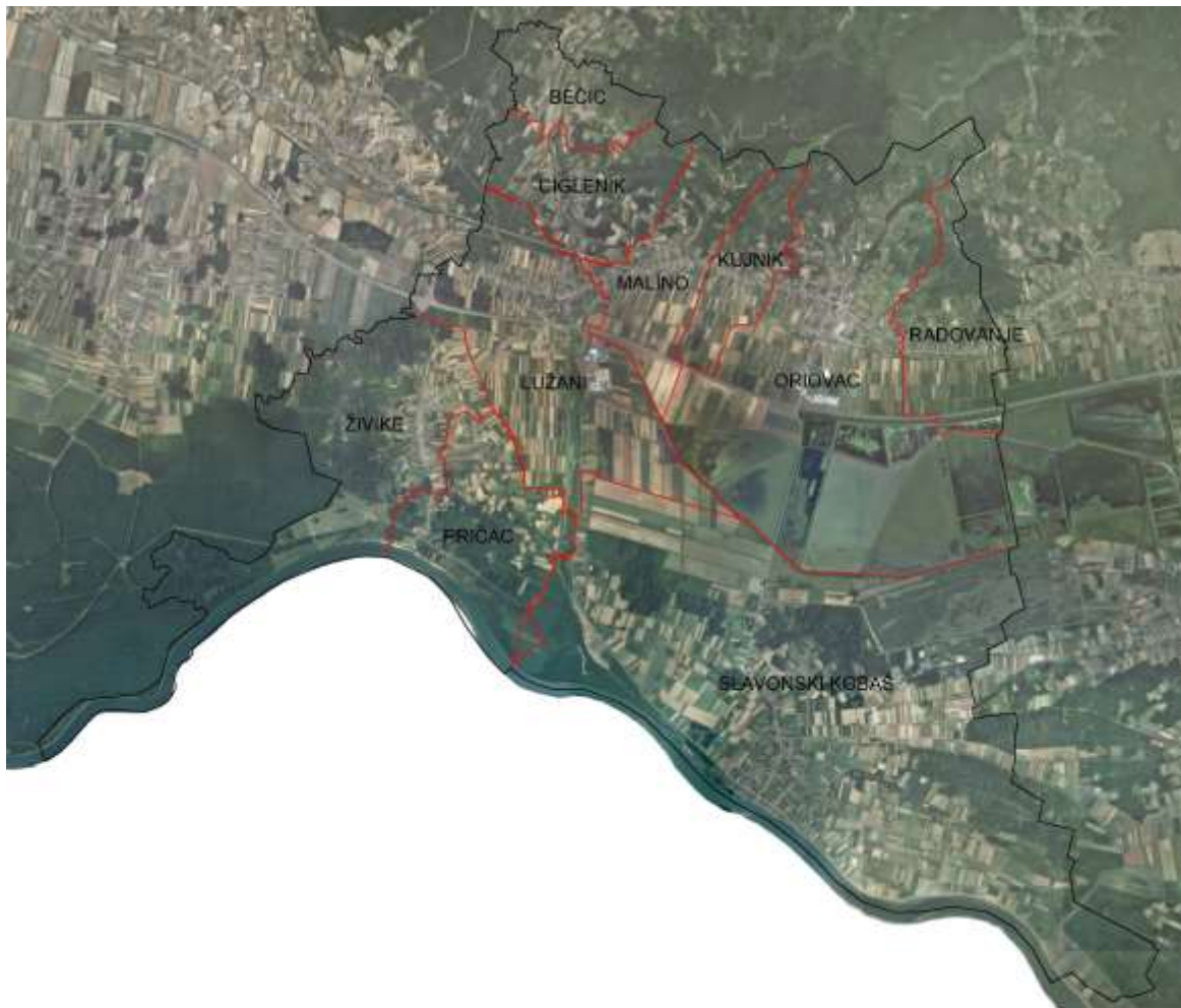
Slika 1. Općina Oriovac sa prikazanim katastarskim općinama

Općina se prostire na 99 km 2 , a sastoji se od 10 katastarskih općina i to: Bečić, Ciglenik (sjeverno uz Orljavu), Kujnik, Lužani, Malino, Oriovac, Radovanje (na glavnoj županijskoj cesti) te Pričac, Slavonski Kobaš i Živike (južno na Savi) kako je prikazano na slici 1.