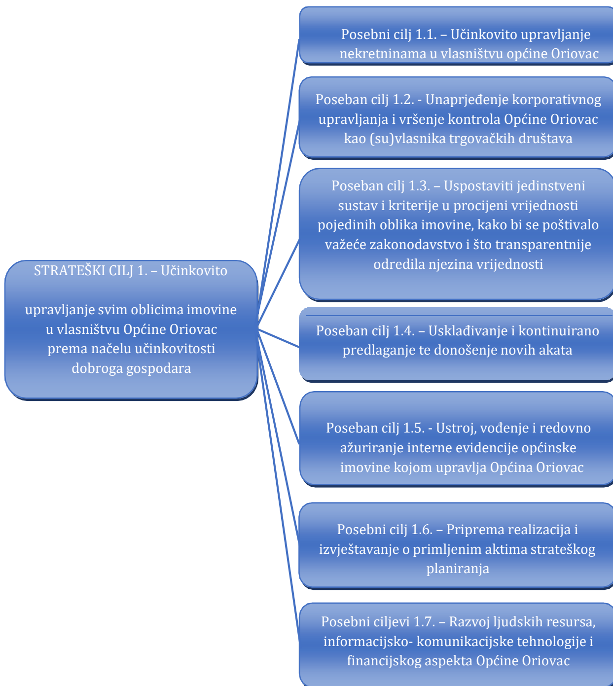
Slika 2. Kaskadiranje strateškog cilja upravljanja općinskom imovinom