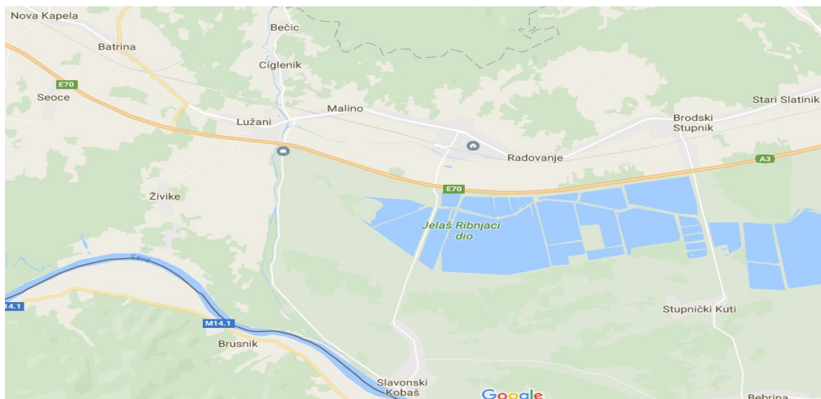
Slika 2.2 Općina Oriovac

Općina Oriovac nalazi se zapadno od županijskog središta Slavanskog Broda te se sastoji od naselja: Bečić, Ciglenik, Kujnik, Lužani, Malino, Oriovac, Pričac, Radovanje, Slavonski Kobaš, Živike.